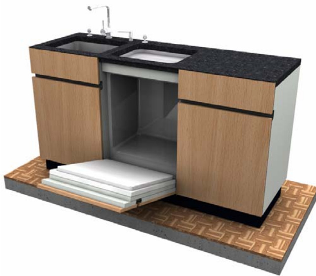
Möbel mit Geschirrspüler und Griffmulde