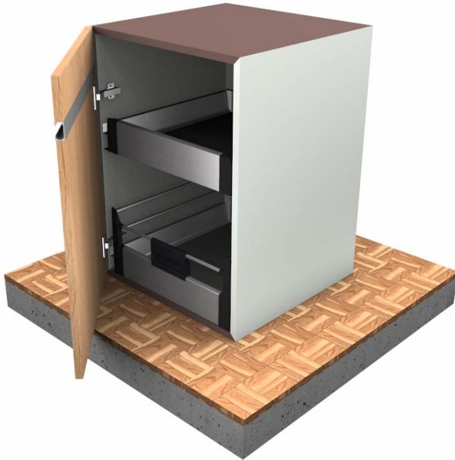
Möbel mit Gehrungskorpus, Türe und Innenauszug mit Abstandhalter

Bei diesem Möbel können alle Ecken sowie auch die Rückwand, einzeln als normale oder als Gehrungsverbindung definiert werden. Die Verbindung der Gehrung erfolgt mittels Gehrungsfedern. Die Innenauszüge besitzen einen Abstandhalter um das Türband zu kompensieren.