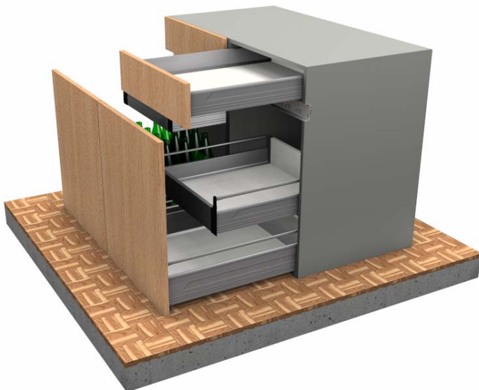
Unterbaumöbel mit Flaschenauszug und Griffmulde