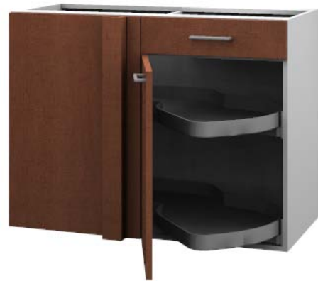
Eckkorpus "Le Mans"