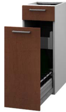
Unterbaumöbel mit Flaschenauszug