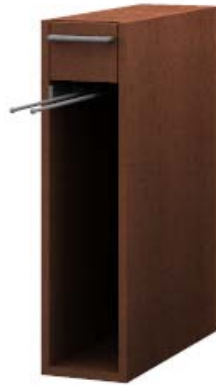
Unterbaumöbel mit Handtuchauszug