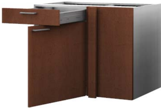
Eckkorpus "Magic Corner"

Die Makrobibliothek ist nun neu auch komplett im Euro-System aufgebaut. Sie besteht aus einer sehr umfangreichen Variationspalette die individuell und sehr einfach angepasst werden kann. So ist das Auswechseln eines Korpus oder eines Frontensystems ohne weiteres möglich. Allfällige Bänder, Schubladen, Innenleben, Bohrungen usw. werden nicht tangiert, d.h. sie bleiben bestehen und müssen nicht neu erzeugt werden. Sämtliche Möbel sind vollumfänglich parametrisiert und mit allen Materialien/Beschlägen vordefiniert.