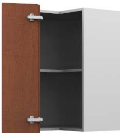
Eckkorpus oben mit Falttüren