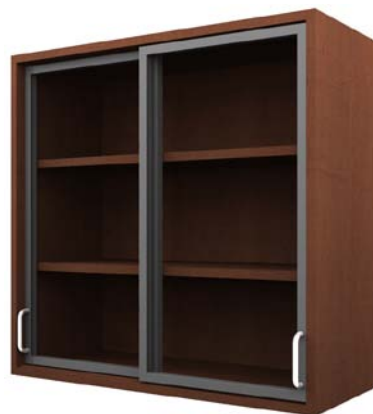
Schrank mit Glasschiebetüren