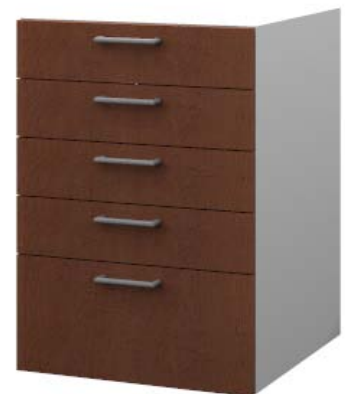
Apparateunterschrank mit 5 Schubladen