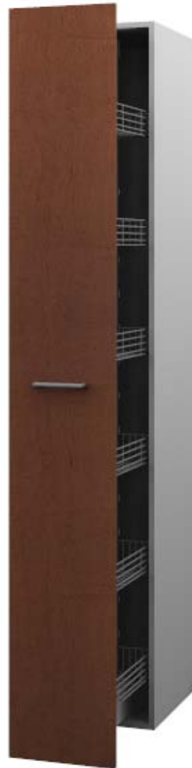
Hochschrank mit Rohrrahmenauszug